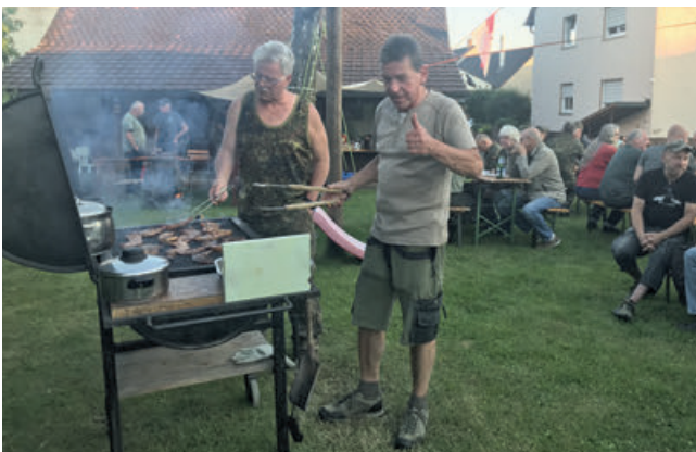
Die Grillmeister in ihrem Element.

Qualität aus einer Hand – von der Beratung und Montage bis zum Kundendienst – alles direkt vom Fachmann!