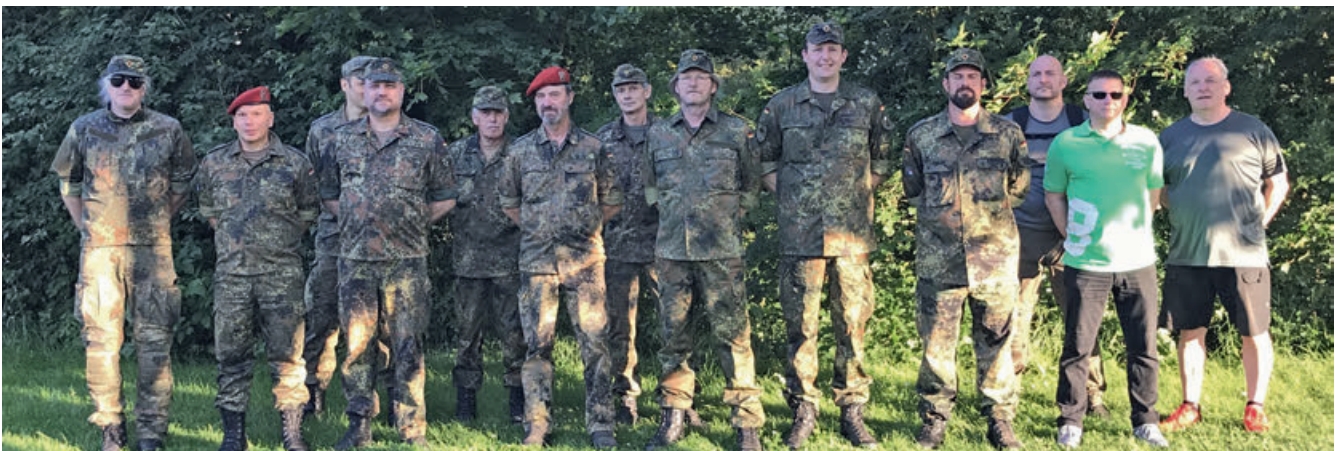
Antreten der Teilnehmer des O-Marsches.