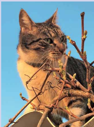
Hier ist die Katze den Vögeln ganz nahe...

Katzen sind Raubtiere, soweit so klar. Bestimmt haben viele Katzenbesitzerinnen und Katzenbesitzer bereits