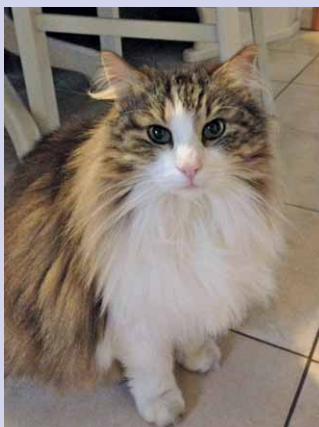
Eine Wohnungskatze, wie sie liebt und lebt.

erlebt, dass die Haustiere „Geschenke“ aus der Wildnis mit nach Hause bringen. Selbst wenn Katzen ausreichend gefüttert werden, jagen sie trotzdem in ihrer Umwelt. Katzen üben somit einen viel höheren Jagddruck auf heimische Kleintiere aus, da sie in über hundertfach höheren Populationsdichten vorkommen als die bei uns eigentlich heimische Wildkatze. Neben Mäusen stehen aber besonders auch Vögel und Eidechsen auf dem Speiseplan, deren Bestände rückläufig sind: 43% der Vogelarten sind auf der roten Liste.