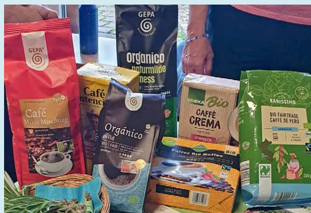
Viele Sorten von Fairem Kaffee gibt es mittlerweile in den Läden. Auf unserem Tisch am Fastenbasar eine kleine Auswahl.